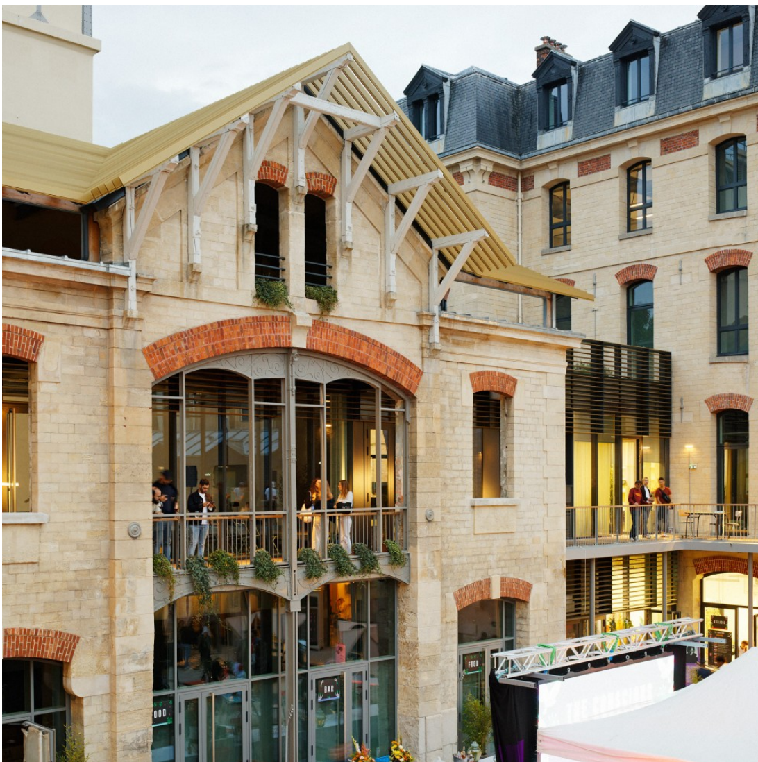
Lieu de travail, de vie et de fête incontournable, la Caserne est